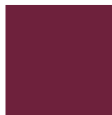
C:40 M:92 Y:55 K:39