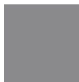
Pantone Cool Gray 8 C